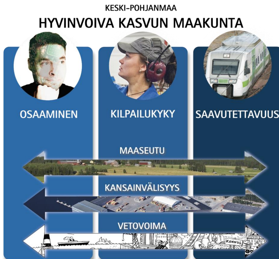
Kuva 3. Maakuntaohjelman kehittämisteemat ja läpileikkaavat painopisteet.

Keski-Pohjanmaan maakuntaohjelman vision mukaisesti Keski-Pohjanmaasta tavoitellaan hyvinvoivaa kasvun maakuntaa (kuva 3). Tavoitetilan saavuttamiseksi maakuntaohjelmassa on kolme kehittämisteemaa: osaaminen, kilpailukyky ja saavutettavuus . Kehittämisteemojen toimenpiteisiin on sisällytetty kolme läpileikkaavaa painopistettä: maaseutu, kansainvälisyys ja vetovoima . Nämä läpileikkaavat painopisteet ovat mahdollistamassa tavoitteiden ja vision toteuttamista jokaisessa kolmessa kehittämisteemassa.