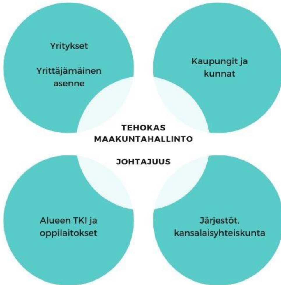
Kuva 1: Ekosysteemipohjainen ajattelu

tavoitteille ja toimeenpanolle yhteistyössä sidosryhmien kanssa. Alueen kilpailukyvyä kehittämisessä tarvitaan kaikkien alueen toimijoiden joustavaa yhteistyötä. Älykkään erikoistumisen toimeenpanossa keskeisiä ovat alueen TKI- ja oppilaitokset, kaupungit ja kunnat, kehittämissyhtiöt, yritykset sekä kansalaisyhteiskunta esimerkiksi järjestöjen kautta.