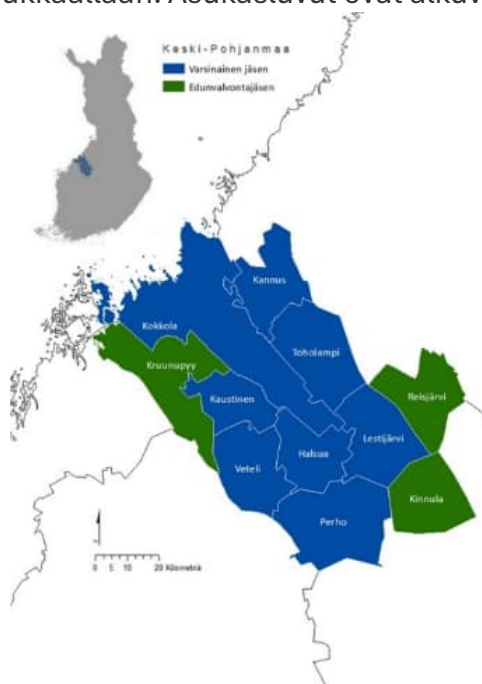
Kuva 1. Keski-Pohjanmaan alue ja kunnat, Keski-Pohjanmaan liitto

Keski-Pohjanmaan liiton varsinaisia jäsenkuntia ovat Kannus, Kokkola, Halsua, Kaustinen, Lestijärvi, Perho, Toholampi ja Veteli (kuva 1). Keski-Pohjanmaan liitolla on osajäseniensä Kruunupyyn (Pohjanmaan maakunta), Reisjärven (Pohjois-Pohjanmaan maakunta) sekä Kinnulan (Keski-Suomen maakunta) alueella edunvalvontavastuu, mutta myös aluekehitystoiminnassaan liitto ottaa huomioon ja kantaa vastuuta osajäsenistään. Keski-Pohjanmaan maakunta on mannersuomen pienin maakunta 67 742 asukkaallaan. Maakunnassa on kaksi kaupunkia, joissa asukkaita Kokkolassa on 48 016 ja Kannuksessa 5 322, muut kunnat ovatkin sitten asukasmäärällään pieniä, alle 5000 asukkaan maalaiskuntia, joista pienin Lestijärvi 684 asukkaallaan. Asukasluvut ovat alkuvuodenvuoden 2023 tilastosta.