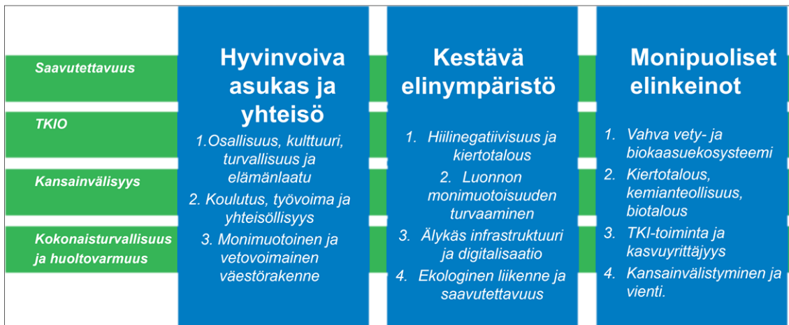
KUVIO 1. Maakuntaohjelman kehittämisteemat sekä poikkileikkaavat teemat.

Jokaisen kehittämisteeman alle on määritelty strategiaan painopisteisiin pohjautuvat tavoitteet ja tässä ohjelmassa määritellään niiden mukaiset toimenpiteet vuosille 2026–2027.