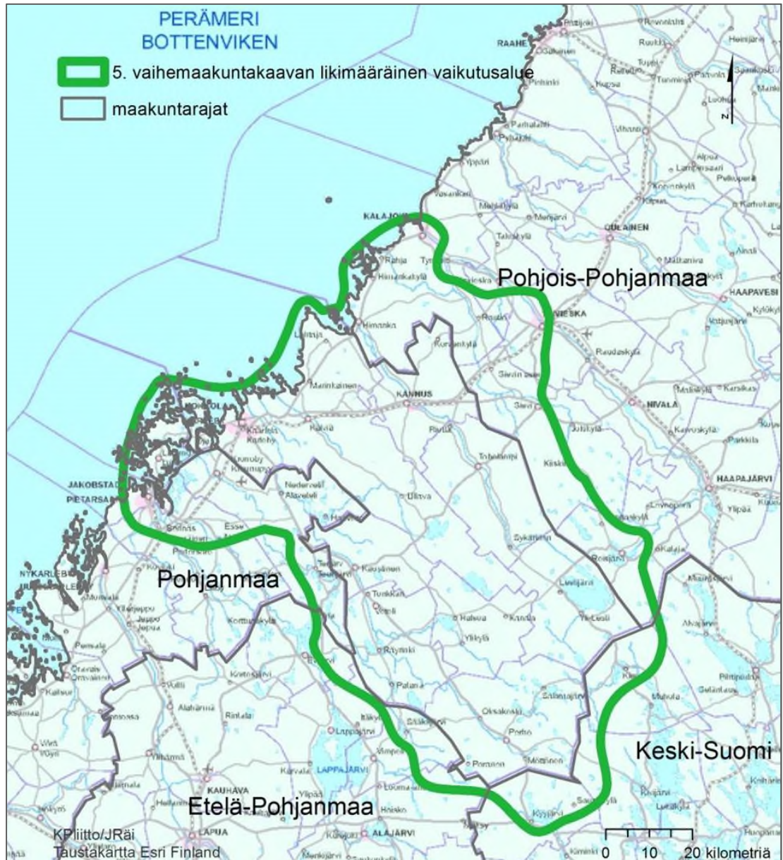
Kuva 3. Keski-Pohjanmaan 5. vaihemaakuntakaavan vaikutusalue.

Keski-Pohjanmaan 5. vaihemaakuntakaavan vaikutukset ulottuvat maakunnan kuntiin sekä jossain määrin naapurimaakuntiin palvelukeskusten asiointialueiden ja kaivostoiminnan vaikutusten kautta.